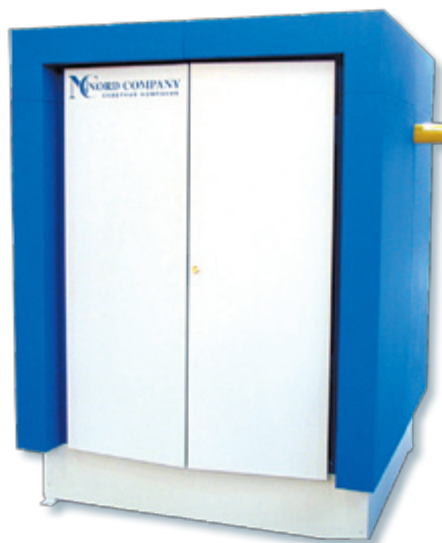
Шкафной регуляторный пункт ШРП-НОРД-2 промышленной серии

Также компания представила газовые фильтры и газовые краны для подземной установки собственного производства.